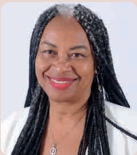
A comissão é presidida pela deputada Olívia Santana (PC do B)

“Entendemos que as Comissões de Prevenção Escolar podem fortalecer o papel da escola dentro do Sistema de Garantia de Direitos, proporcionando maior atenção com as crianças e adolescentes mais vulneráveis, minimizando a evasão escolar, com envolvimento das famílias no cuidado e na proteção à infância”, afirmou a parlamentar.