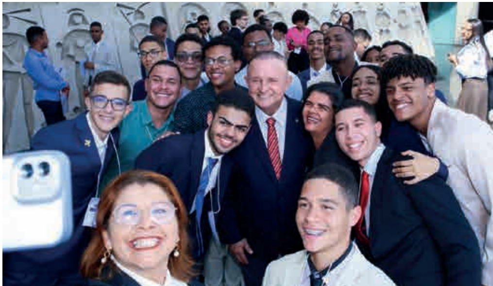
Na reunião com os estudantes, o presidente da ALBA afirmou que DJU ajuda a combater a criminalização da política

“Como vou atuar no ramo do Direito, acredito que esse momento tem sido a confirmação de que esse é o universo que eu realmente quero. É um prazer enorme estar aqui na Assembleia, com tanta gente qualificada e uma equipe maravilhosa organizando este evento. Nunca imaginei ser