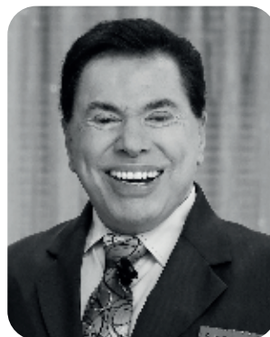
Parlamentar prestou homenagem ao comunicador

de alto-falante e desta forma começou a sua carreira como camelô”, contou a deputada.