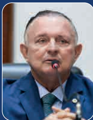
Falecimento do apresentador e empresário consternou o presidente da ALBA

Ainda lamentando o desaparecimento desse ícone da televisão