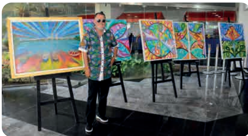
Intitulada Encontro das Águas, a exposição do artista plástico tem 14 telas abstratas e figurativas

No primeiro dia de exposição, o pintor está animado com a divulgação do evento nos meios de comunicação, e com o começo de contato com os servidores e visitantes. Para ele, expor na Casa Legislativa é muito importante, “para ampliar meu currículo, divulgar meu trabalho e impulsionar a venda das minhas obras”, colocou.