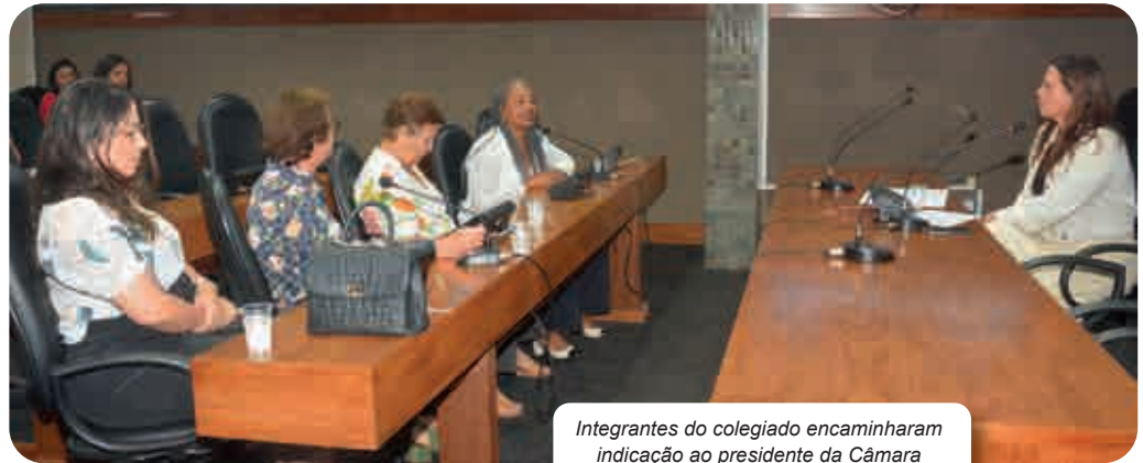
Integrantes do colegiado encaminharam indicação ao presidente da Câmara dos Deputados, Arthur Lira

Para os membros da comissão, é alarmante que, em pleno século XXI, haja um debate sobre a legislação “que não apenas nega o direito ao aborto em circunstâncias extremamente traumáticas, mas também impõe punições severas às mulheres que já enfrentam situações de profundo sofrimento e vulnerabilidade”. A indicação considera que a enquete recente realizada no