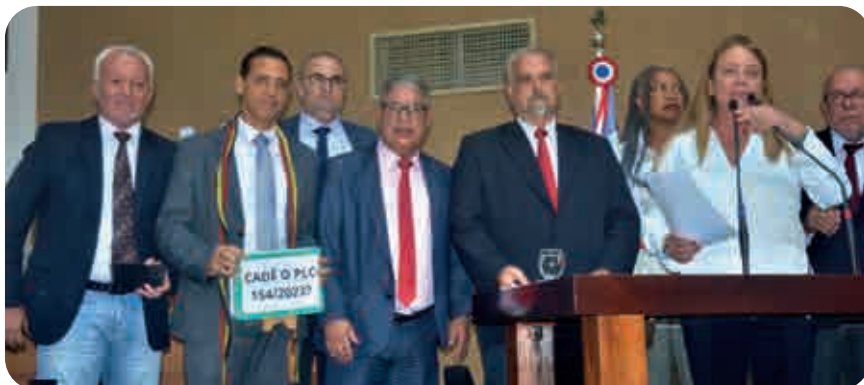
Deputados também apreciaram mais 13 projetos de autoria parlamentar