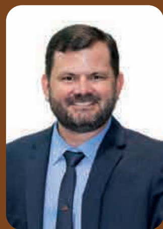
Deputado Angelo Coronel Filho (PSD)

“Pelos importantes motivos expostos, é que venho prestar esta justa homenagem ao Município de Brumado e ao seu povo, pela passagem dos seus 147 anos de fundação. Em oportuno, solicito ainda que seja dado conhecimento desta moção à Prefeitura Municipal de Brumado e à Câmara Municipal de Vereadores, fazendo assim chegar a todos aqueles que lá moram”, concluiu.