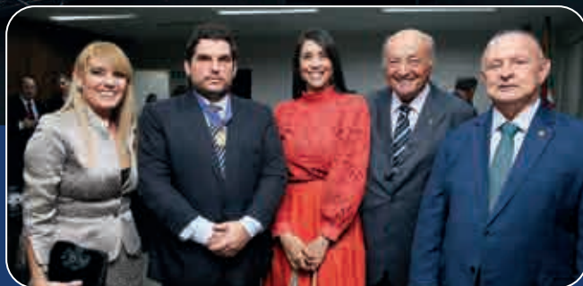
Presidente da ALBA desejou ao novo desembargador eleitoral "um bom mandato"