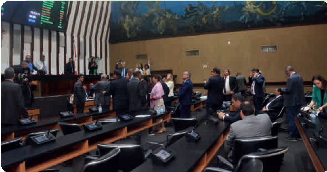
Parlamentares deram aval ao pagamento da terceira parcela dos precatórios dos professores e para a criação de 561 novos cargos na Delegacia de Polícia Técnica

A Assembleia Legislativa iniciou os trabalhos plenários da terça-feira com o propósito de apreciar quatro proposições que vêm dominando os debates nas últimas semanas. Porém, um acordo entre os líderes dos blocos da maioria e da minoria permitiu a inversão da pauta para votar e aprovar de pronto o projeto de lei proposto pelo Governo do Estado prevendo o pagamento da terceira parcela dos precatórios dos professores, nas mesmas condições das parcelas anteriores. Também originária do Poder Executivo, foi aprovada a proposição que prevê a criação de 561 novos cargos na Delegacia de Polícia Técnica para absorver imediatamente pessoal já aprovado em concurso para cadastro de reserva.