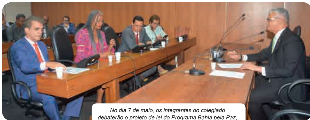
No dia 7 de maio, os integrantes do colegiado debaterão o projeto de lei do Programa Bahia pela Paz, elaborado pelo Governo do Estado