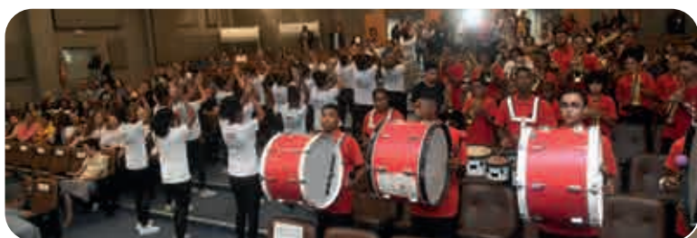
A Fanfarra do Colégio Estadual Duque de Caxias (Fanduc), da Liberdade, um dos bairros mais negros de Salvador, executou clássicos da música baiana