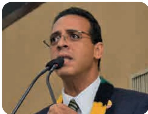
Deputado Hilton Coelho (Psol)

Ao justificar a medida, Hilton enfatizou a importância de compreender o passado para entender o presente, além de fomentar o debate público sobre a Ditadura no Brasil, especialmente na Bahia. “Enquanto muitos estados brasileiros disponibilizam fundos documentais de suas respectivas Del-