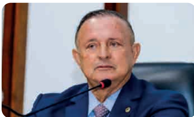
Presidente da ALBA elogiou a "forte tradição" do município na pecuária