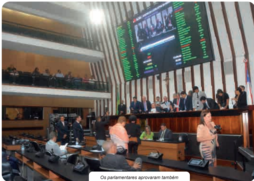
Os parlamentares aprovaram também mais 51 projetos, em um esforço concentrado para limpar a pauta

A outra matéria foi a 24.960, que extingue e transforma cargos permanentes, a fim de dotar o Judiciário de pessoal capacitado para garantir o bom funcionamento das atuações on-line. Os deputados se debruçaram sobre o PL 25.155, de autoria do Poder Executivo que promove alterações na lei que instituiu o Fundo Financeiro da Previdência Social dos Servidores Públicos do Esta-