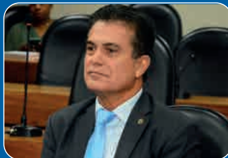
Deputado Eduardo Salles (PP)

que, nesse contexto, a irrigação deve desempenhar um papel cada vez mais estratégico, porque altera a forma como o solo é utilizado, possibilitando o seu uso durante todo o ano, trazendo benefícios econômicos, sociais, ambientais e ainda a possibilidade de uma produção sustentável de alimentos. "Em cenário de grande variabilidade climática, que impacta e muito a produção de sequeiro, espera-se uma consolidação e crescimento da técnica", pontuou.