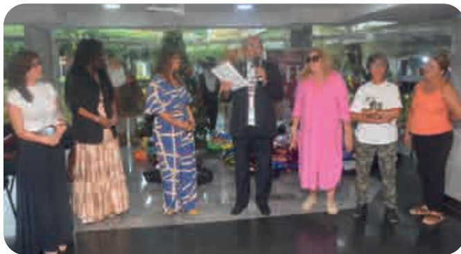
Iniciativa foi do deputado José de Arimateia (Republicanos)

Em clima de festa, o deputado José de Arimateia (Republicanos) encerrou, nesta quarta-feira (20), no Espaço Cultural Josaphat Marinho, a campanha Natal Solidário Pet, que durante este mês de dezembro, nas cidades de Salvador, Feira de Santana, Camaçari e Itabuna, arrecadou 700 quilos de ração para cães e gatos abandonados. O parlamentar agradeceu as doações feitas por deputados, servidores e visitantes, revelando sua satisfação em lutar pela causa animal. “Aprovamos hoje, no plenário da Casa Legislativa, mais um projeto de lei, ao instituir o Dia Estadual dos Protetores dos Animais, data que será comemorada anualmente em 4 de outubro”, anunciou o presidente da Frente Parlamentar em