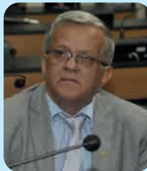
Entrega da Comenda 2 de Julho ao parlamentar ocorre no Plenário Orlando Spinola, às 10h

etós ou apresentações longas", Raimundinho da JR virou caminhoneiro e rodou o país.