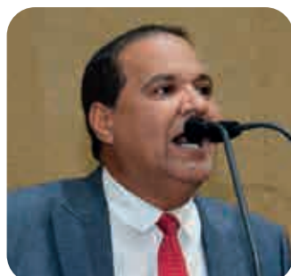
Deputado Eures Ribeiro (PSD)

Eures lembra que o ex-secretário de Promoção da Igualdade do Estado em 2003 e 2008, também trabalhou no passado como vigilante (1974-1976) e técnico químico (1976-1994) na Petrobras. Enquanto sindicalista, atuou como secretário-geral do Sindicato dos Petroleiros