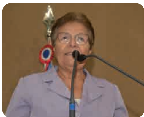
Deputada Fátima Nunes (PT) é a líder do PT na ALBA

O município faz limite com Feira de Santana, Lamarão, Tanquinho, Serrinha, Candeal e Santanópolis e está a 147 quilômetros de Salvador. Possui, aproximadamente, 21 mil habitantes e tem um clima semiárido.