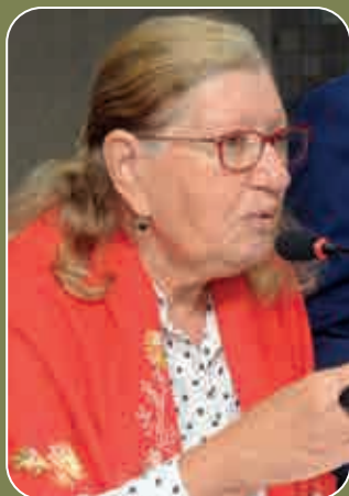
Deputada Maria del Carmen (PT)

A deputada Maria del Carmen (PT) apresentou, na Assembleia Legislativa da Bahia (ALBA), indicação com endereçamento ao governador Jerônimo Rodrigues e ao secretário estadual de Infraestrutura, Sérgio Brito, solicitando a pavimentação asfáltica das ruas do Campo e das Flores, no distrito de Alagadiço, pertencente ao município de Ourulândia.