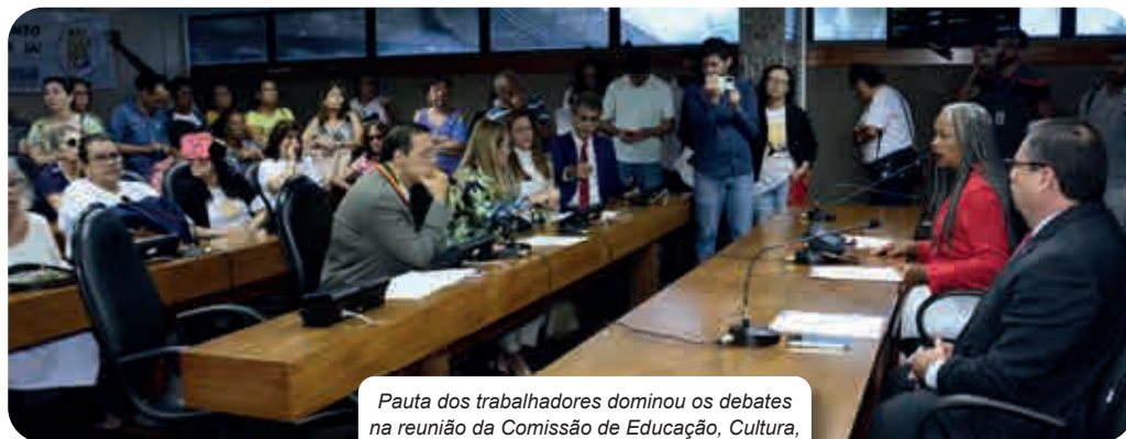
Pauta dos trabalhadores dominou os debates na reunião da Comissão de Educação, Cultura, Ciência e Tecnologia e Serviço Público