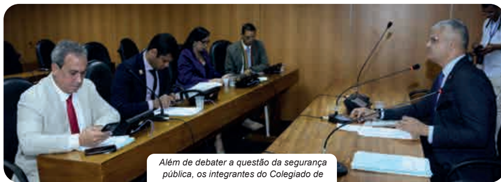
Além de debater a questão da segurança pública, os integrantes do Colegiado de Direitos Humanos aprovaram projetos de lei