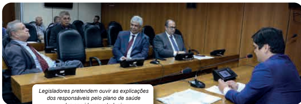
Legisladores pretendem ouvir as explicações dos responsáveis pelo plano de saúde dos servidores estaduais