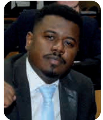
Deputado Pancadinha (Solidariedade)

Nesse sentido, continuou Pancadinha, o investimento em obras de pavimentação asfáltica, além de promover a mobilidade nos bairros, contribui para a melhoria da saúde pública ao reduzir a emissão de poeira, auxiliando na prevenção de doenças respiratórias, alergias e problemas de saúde relacionados à poluição do ar. “Além disso, evita a formação de poças de água, diminuindo a proliferação de mosquitos transmissores de doenças”, frisou.